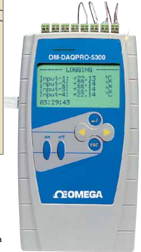
OM-DAQPRO-5300, con sensores, se muestra en un tamaño inferior al real