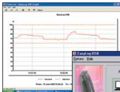
El software para Windows muestra los datos en formato gráfico