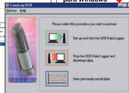
Pantalla de configuración del software para Windows