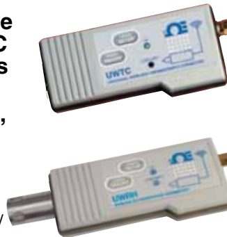
Transmisor de termopar UWTC-1.