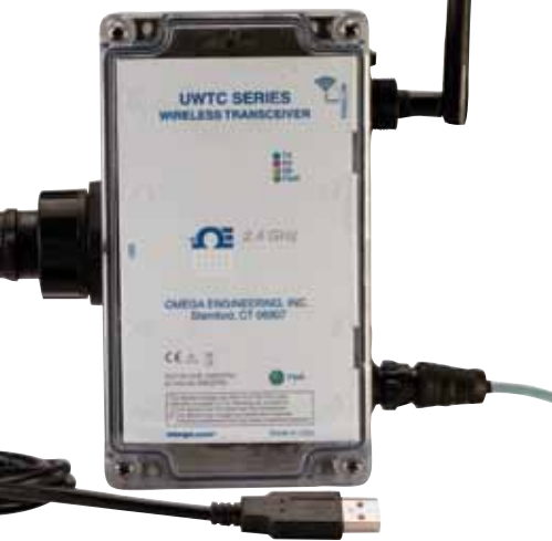
UWTC-REC1-NEMA con carcasa NEMA.

Receptor de 32 canales con ethernet UWTC-REC3. ¡Con conexión a Internet! El receptor/ordenador central UWTC-REC3 con ethernet es compatible con los transmisores de serie UWTC, UWRTD, UWRH y UWIR y se conecta directamente a su red o Internet sin necesidad de un ordenador.