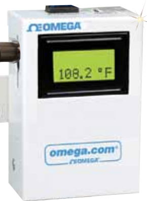
UWTC-REC2-D con salida analógica y pantalla.

Todos los modelos se muestran en un tamaño inferior al real.