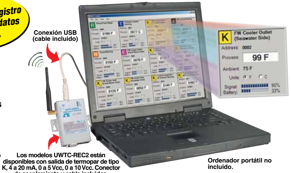
Conexión USB (cable incluido)

Compatible con Windows 32-bit (2000, XP, Vista o 7) Última versión de software para descargar gratis en ftp.omega.com