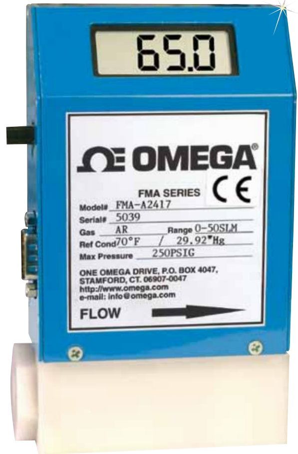
El modelo FMA-A2417 con pantalla se muestra en un tamaño inferior al real.

Los medidores y reguladores electrónicos de flujo másico de la serie FMA-A2000 ofrecen eficacia, versatilidad, y diseño de vanguardia en un paquete compacto. El FMA-A2000 utiliza tecnología térmica de capilares para la medición de caudal másico de gases en forma directa. No necesita correcciones de temperatura, presión o raíz cuadrática. La serie FMA-A2300/2400 está equipada con una pantalla LCD y todos los modelos cuentan con salida lineal de 0 a 5 Vcc y 4 a 20 mA.