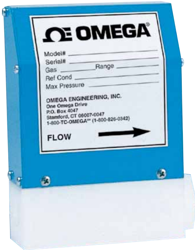
El modelo FMA-A2117 sin pantalla se muestra en un tamaño inferior al real.