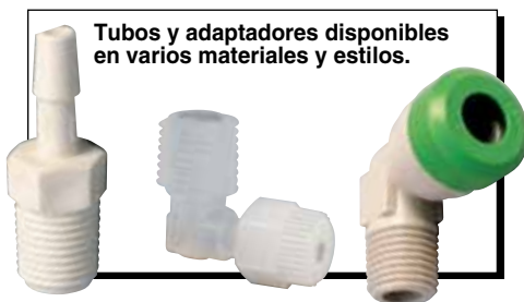
Tubos y adaptadores disponibles en varios materiales y estilos.

FMA-A2102-SS, medidor de flujo másico con cuerpo en acero inoxidable 316 sin pantalla, 0 a 50 SCCM.