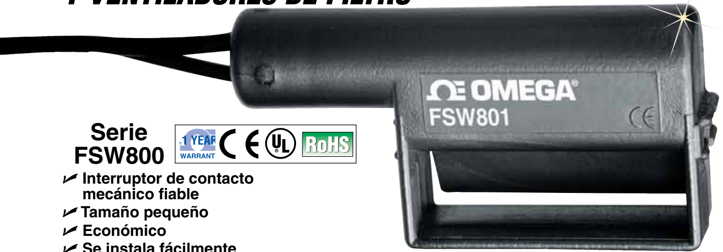
El modelo FSW801 se muestra en un tamaño mayor al real.