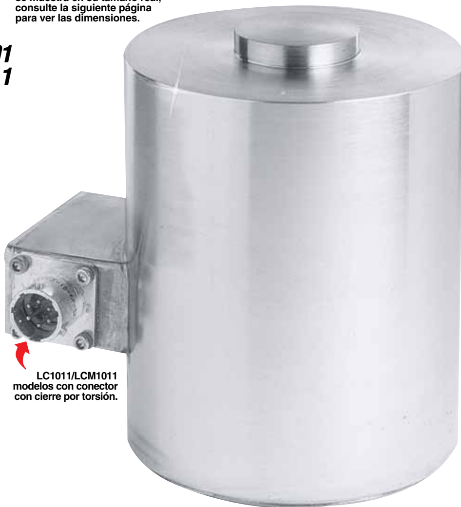
LC1011/LCM1011 modelos con conector con cierre por torsión.

Repetibilidad: \pm 0,02\% salida a escala completa