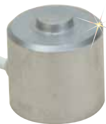
El modelo LC304-1K se muestra en su tamaño real.