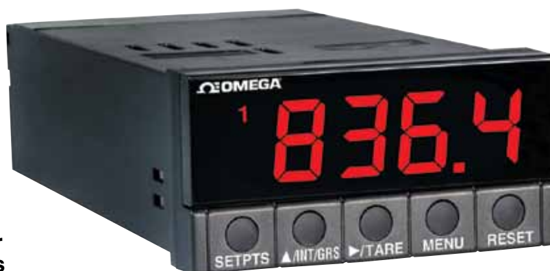
El modelo DP25B-S se muestra en un tamaño inferior al real.