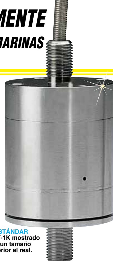
ESTÁNDAR LCUW-1K mostrado en un tamaño inferior al real.