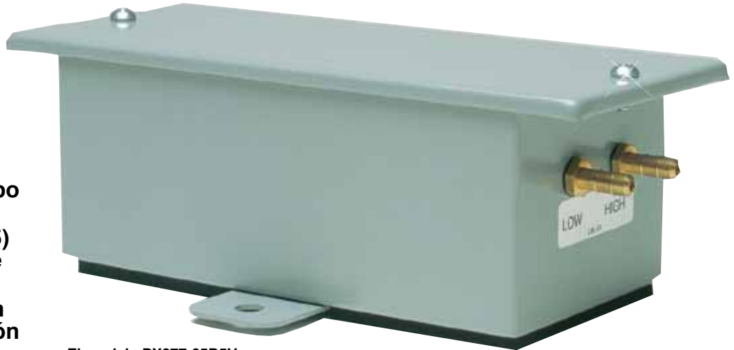
El modelo PX277-05D5V se muestra en un tamaño inferior al real.

Temperatura compensada: -4 a 65 °C (25 a 150 °F)