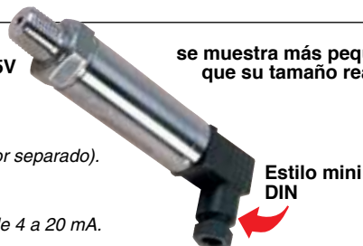
Estilo mini DIN

se muestra más pequeño que su tamaño real.