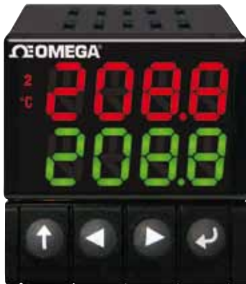
El modelo CN16DPt se muestra en su tamaño real.

El controlador más potente del mercado, es ahora el más fácil de usar