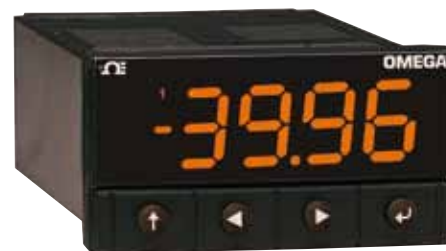
El modelo CN32Pt se muestra en su tamaño real.