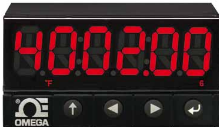
El modelo CN8DPt se muestra en su tamaño real.