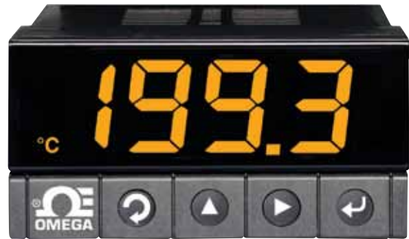
El modelo DPI8 se muestra en un tamaño inferior al real.