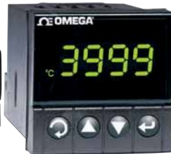
El modelo DPI16 se muestra en un tamaño inferior al real.