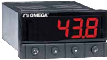
El modelo DPI32 se muestra en un tamaño inferior al real.