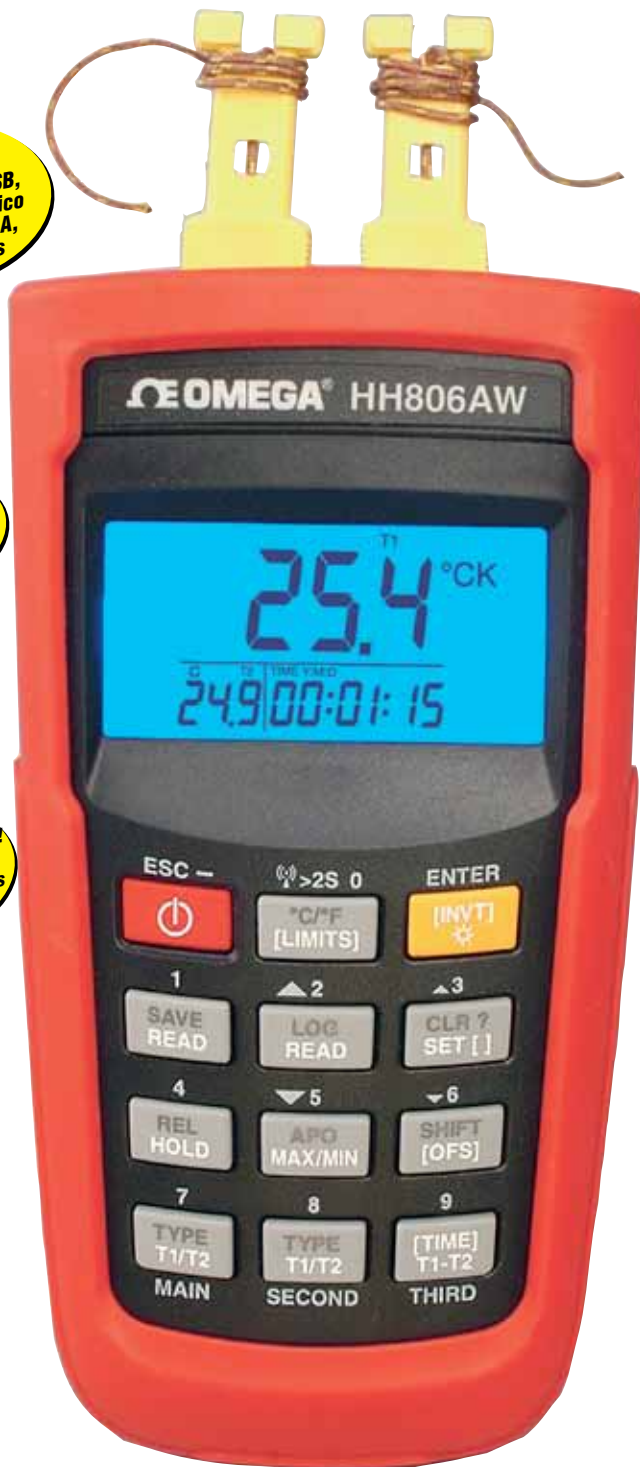
El modelo HH806AW se muestra en su tamaño real.

Precisión: establecida a 23 C ±5 C, <75% HR