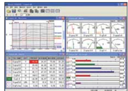
Software de la aplicación