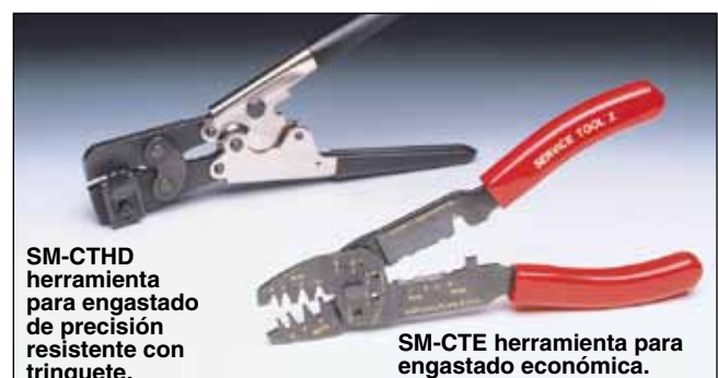
SM-CTHD herramienta para engastado de precisión resistente con trinquete.