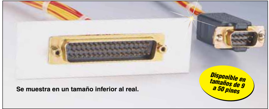
Se muestra en un tamaño inferior al real.