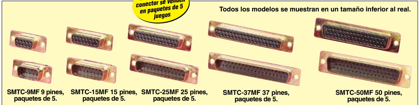
SMTC-9MF 9 pines, paquetes de 5.

Todos los modelos se muestran en un tamaño inferior al real.