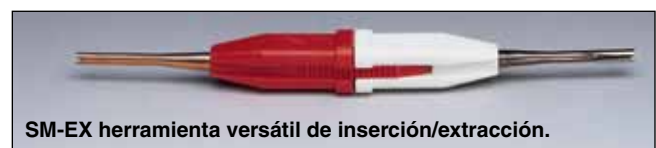
SM-EX herramienta versátil de inserción/extracción.