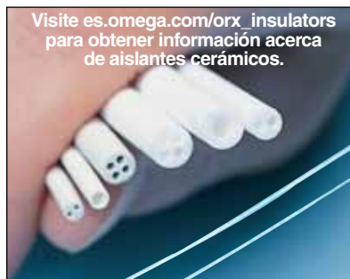
Visite es.omega.com/orx_insulators para obtener información acerca de aislantes cerámicos.

Los termopares de tungsteno-renio OMEGA tienen una longitud de 300 mm (12") cada uno, lo cual corresponde a una longitud total de 600 mm (24"). Hay cables de mayor longitud disponibles; consulte al departamento de ventas.