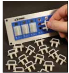
Tapas anti-polvo opcionales, SPJ-CAP, Pack de 12

Nuevo estándar de la industria. Dos conectores en uno.